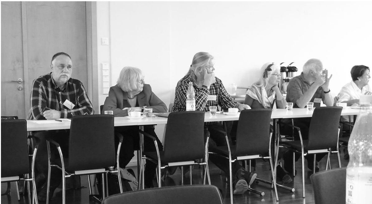
In den Workshops am Nachmittag diskutierten die Teilnehmer in kleineren Runden die zentralen Fragen, die der Expertenrunde vorlagen

Welchen Risiken setzen sich psychiatrisch Tätige aus, die ohne oder gegen ärztliche Anweisung Patienten beim Absetzen unterstützen?