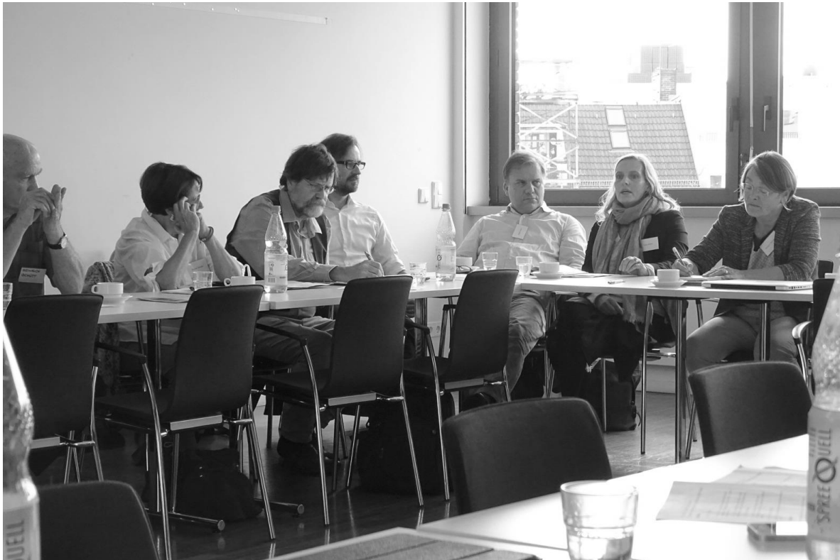
Über 30 Experten und Expertinnen nahmen aktiv an dem Austausch teil