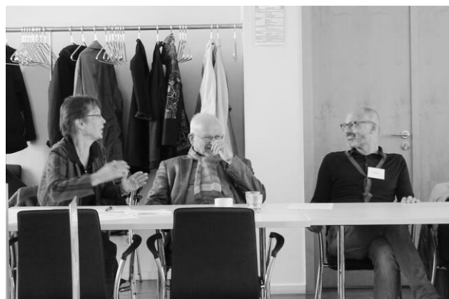
Es herrschten rege Gespräche